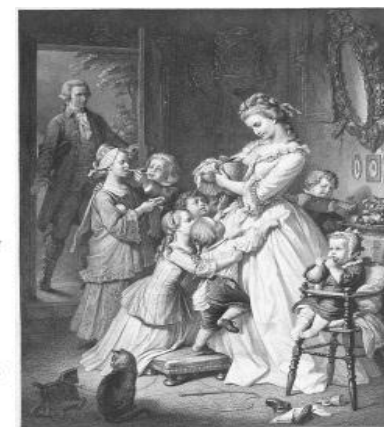
社名の由来である “若きウェルテルの悩み”のヒロイン 「シャルロッテ」