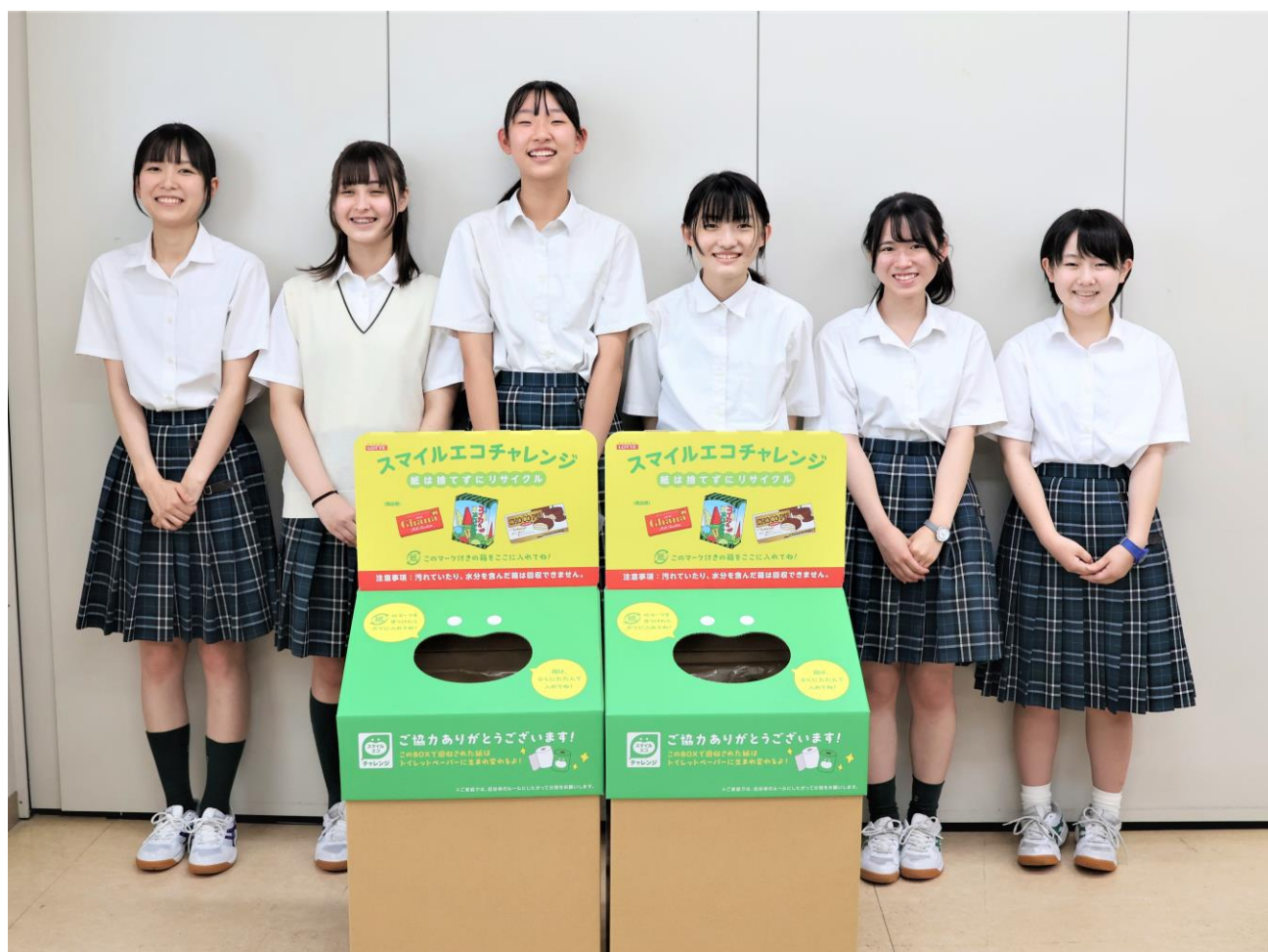
トキワ松学園生徒会の皆さまとリサイクル回収箱（上） 再生トイレトペーパーを寄贈予定※パッケージデザインはイメージです（右）

株式会社ロッテ（本社：東京都新宿区、以下ロッテ）はこのたび、トキワ松学園中学校高等学校（所在地：東京都目黒区）生徒会と協力し、紙製容器包装のリサイクル活動を推進いたします。同校内にリサイクル回収箱を設置し、2023年9月より回収を開始します。日本では、新聞やチラシ、段ボールといった古紙の回収は積極的に行われていますが、紙製容器包装の回収率は低い、という現状があります。そこで、紙製容器包装のリサイクル意識を高める一助として本取り組みを実施することにいたしました。今回、古紙再生の専門技術を持つコアレックス信栄株式会社（本社：静岡県富士市）に協力をいただき、回収された紙製容器包装はトイレトペーパーに再生されます。後日、回収量に応じて同社製品のトイレトペーパーをロッテからトキワ松学園中学校高等学校に寄贈します。当社では、本件の他にも ガムボトルの容器回収リサイクルの実証実験 を行うなど、容器包装等における持続可能な社会の実現に挑む様々なチャレンジを「スマイルエコチャレンジ」と名付けて実施しています。引き続きステークホルダーの皆さまと共にサプライチェーン全体での持続可能な社会の実現に向けた「スマイルエコチャレンジ」を推進してまいります。