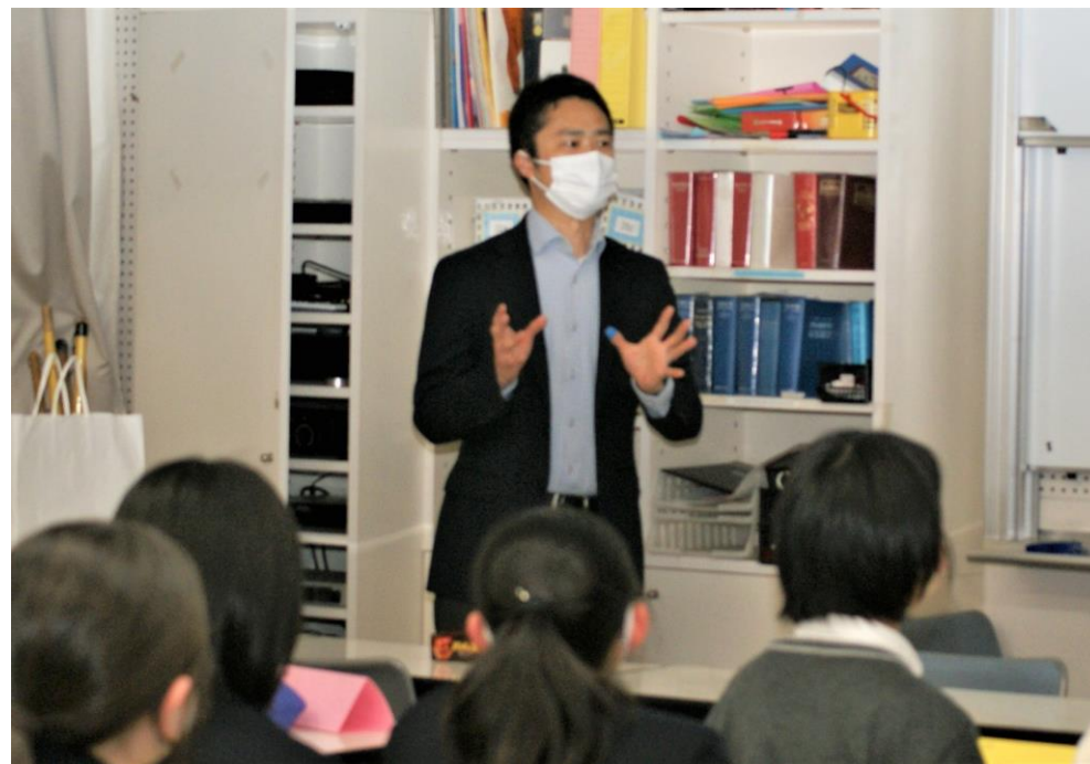
ロッテ・藤原よりトキワ松学園生徒会の皆さまに本取り組みを説明（上）回収箱の設置イメージ（右）